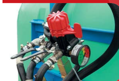
Comando de Pulverización