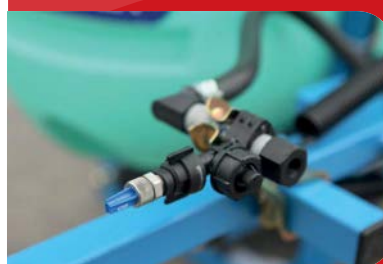
Punta de Pulverización