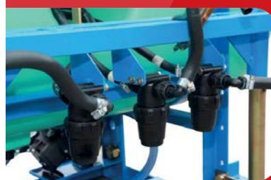
Bomba de Pulverización